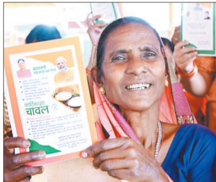
जिले में 2 लाख 63 हजार से अधिक राशनकार्डधारी हितग्राहियों को दिया जा रहा खाद्यान्न

इसी प्रकार 1,83,521 प्राथमिकता राशन कार्ड धारियों को 1 से 2 सदस्यों के लिए 10 किलो प्रति सदस्य के मान से प्रतिमाह एवं 3 से 5 सदस्य वाले परिवारों को 7 किलो चावल प्रति सदस्य प्रतिमाह प्रदाय किया जा रहा है। 670 एकल निराश्रित एवं 217 निःशक्तजन राशनकार्ड पर 10 किलो चावल प्रतिमाह निःशुल्क प्रदाय किया जा रहा है। राज्य शासन के निर्णय अनुसार जनवरी 2024 से दिसम्बर 2028 तक समस्त अन्वयदय तथा प्राथमिकता कार्डधारियों हेतु चावल की उपभोक्ता दर निःशुल्क होगी। जिले में कुल 2 लाख 63 हजार 195 राशनकार्ड प्रचलित है जिनको खाद्यान्न उपलब्ध कराया जा रहा है। इनमें 17 हजार 315 एपीएल कार्ड भी शामिल हैं। सार्वभौम पीडीएस के अंतर्गत जिले में 17,315 सामान्य परिवारों (आयकरदाता एवं गैर आयकरदाता) को भी खाद्यान्न प्रदाय किया जा रहा है। सामान्य